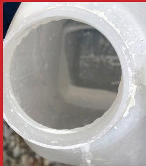
Fórmula seca en la rosca