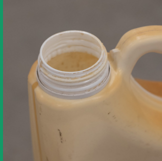
Mancha en manija y cuello, pero limpios