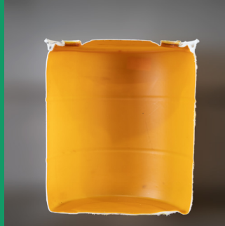
Mancha interna, pero enjuagado y limpio