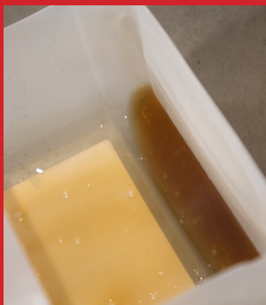
Residuo líquido en el recipiente