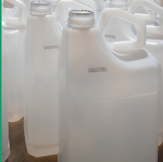
Recipiente, rosca y borde están limpios