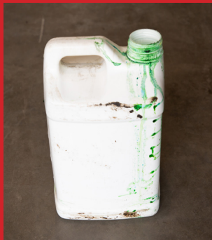
Fórmula seca en el recipiente