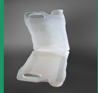
Interior está limpio y seco